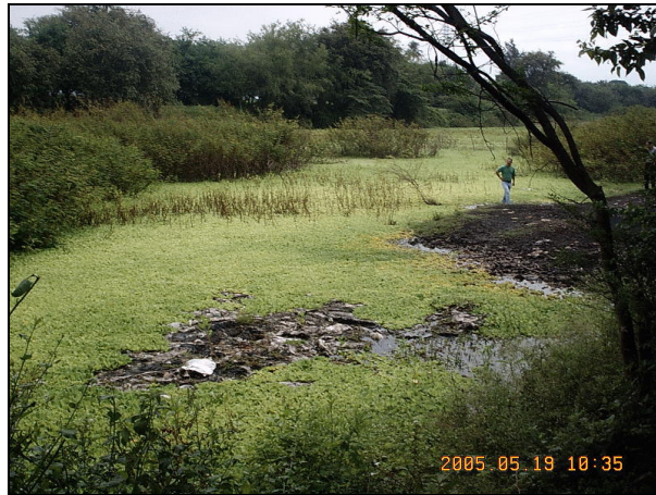
FOTOGRAFIA No.3. Escombros en medio del espejo de agua en Higerón.

No existe una comunidad permanente salvo el caso de trabajadores de la empresa Carton de Colombia y una casa de habitación a la entrada del humedal.