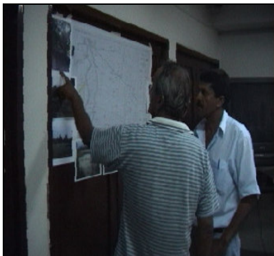
FOTO No. 4. Socialización del Plan de Manejo ambiental.