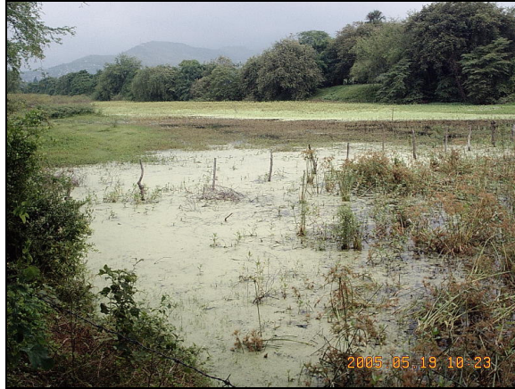
FOTOGRAFIA No. 11. Humedal Higuérón , época de invierno (espejo de agua )

REG. #0999 MAYO 18/2001 C/COMERCIO CALI-VALLE-COLOMBIA