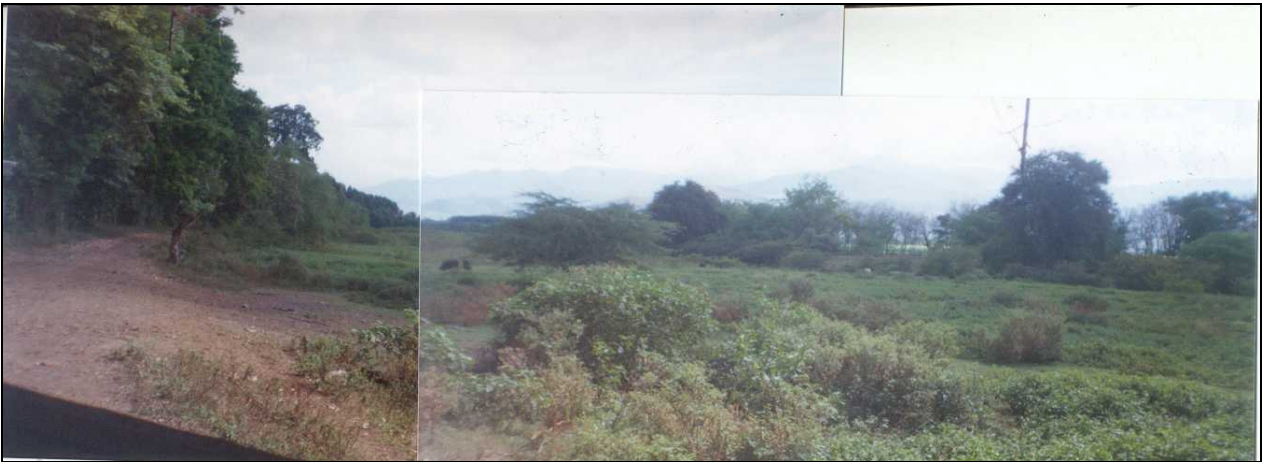
FOTO No. 6. Vegetación de Bosque Seco en el Ecosistema del Humedal Higuieron por Desecamiento

REG. #0999 MAYO 18/2001 C/COMERCIO CALI-VALLE-COLOMBIA