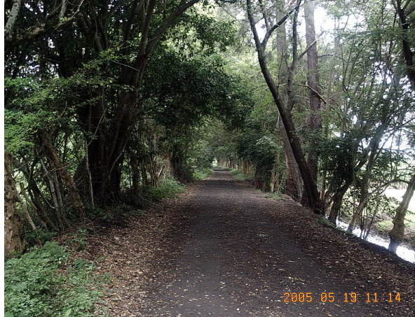
FOTOGRAFÍA No. 2. Alameda de Higerón.