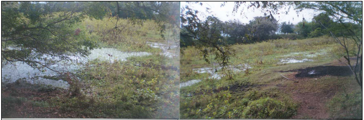
FOTO No. 8. Espejo de Agua sin Escombros y con Buchon de Agua

REG. #0999 MAYO 18/2001 C/COMERCIO CALI-VALLE-COLOMBIA