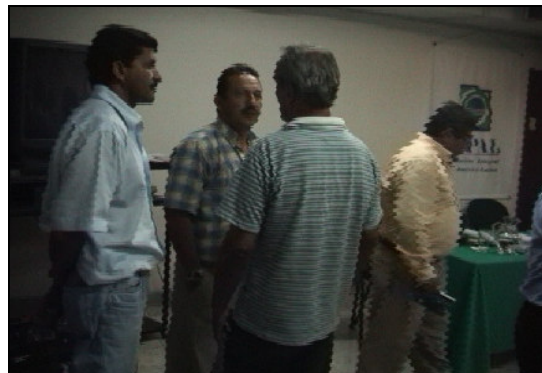
FOTO No. 5. Líderes Comunitarios

La comunidad de Higuera está compuesta aproximadamente por 20 personas, quienes son trabajadores agrícolas y solo pernoctan en sus viviendas cerca al humedal.