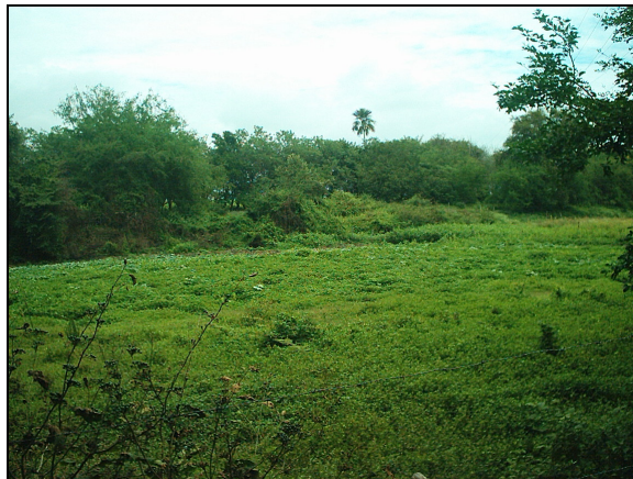
FOTOGRAFIA No. 10. Humedal Higuierón , época de verano (sin espejo)

Este tipo corresponde al (ambiente 1), áreas de inundación y pantanosas (ambiente 2), también es estacional, depende de la temporada de lluvias, consta de plantas acuáticas no enraizadas al sustrato. Predominan el junco ( Typha sp. ), tabaquillo ( Polygonum sp. ) y pastos (de la familia Poaceae) de diferentes variedades .