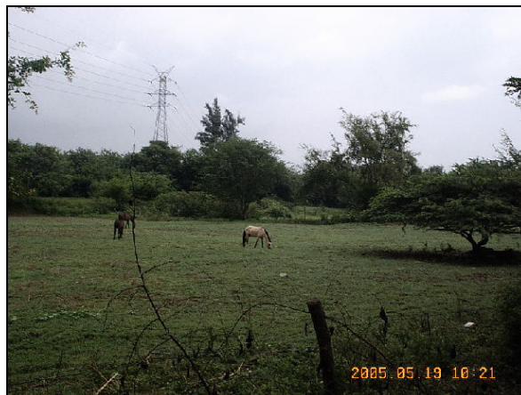
FOTO No. 7. Invasión del Humedal por prácticas agrícolas inadecuadas

Este cambio de estructura vegetal se debe al taponamiento con jarillones en las entradas directas del Río Cauca, convirtiendo al humedal en estacionario (dependiendo de los ciclos de lluvias). Cabe anotar que después de la construcción de los jarillones por parte de parte de Cartón de Colombia y los dueños de los predios, este humedal pasó de ser permanente a ser estacional.