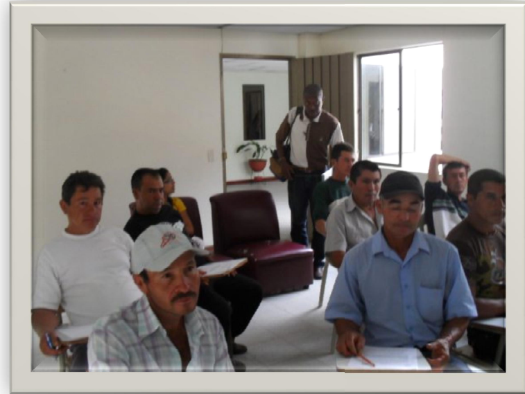
Talleres de Educación y Sensibilización Ambiental