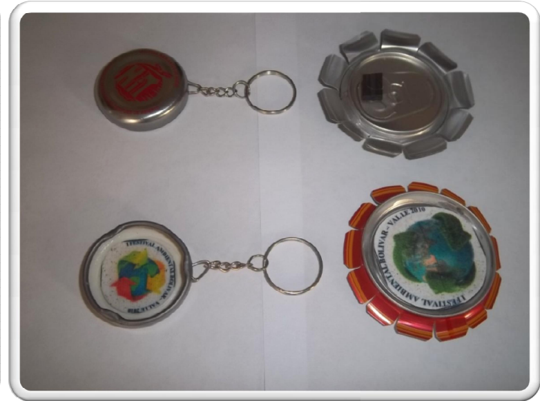
Boligrafos y llaveros