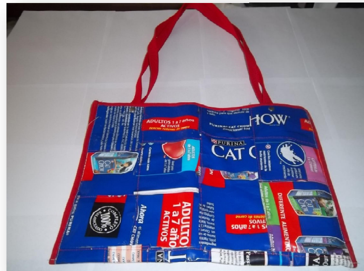
Imanes para Neveras y trabajos de reciclaje con productos utilizados