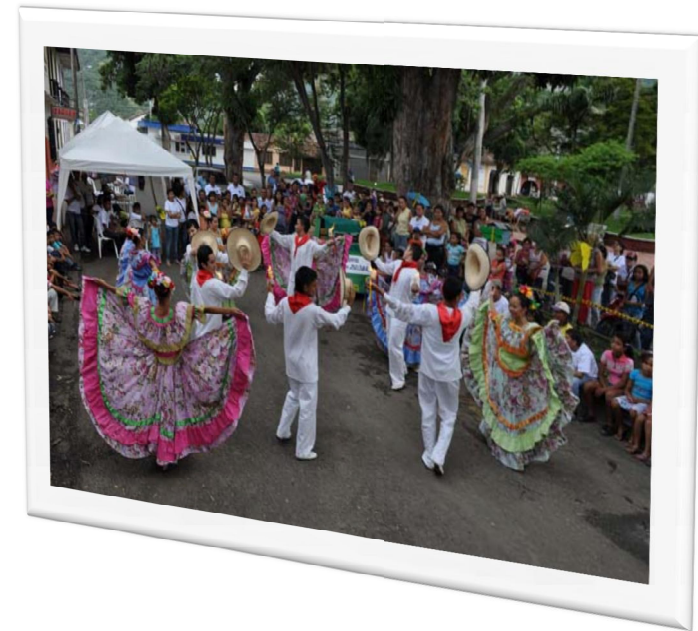
Comparsas y festival como campañas de Educación y Sensibilización Ambiental