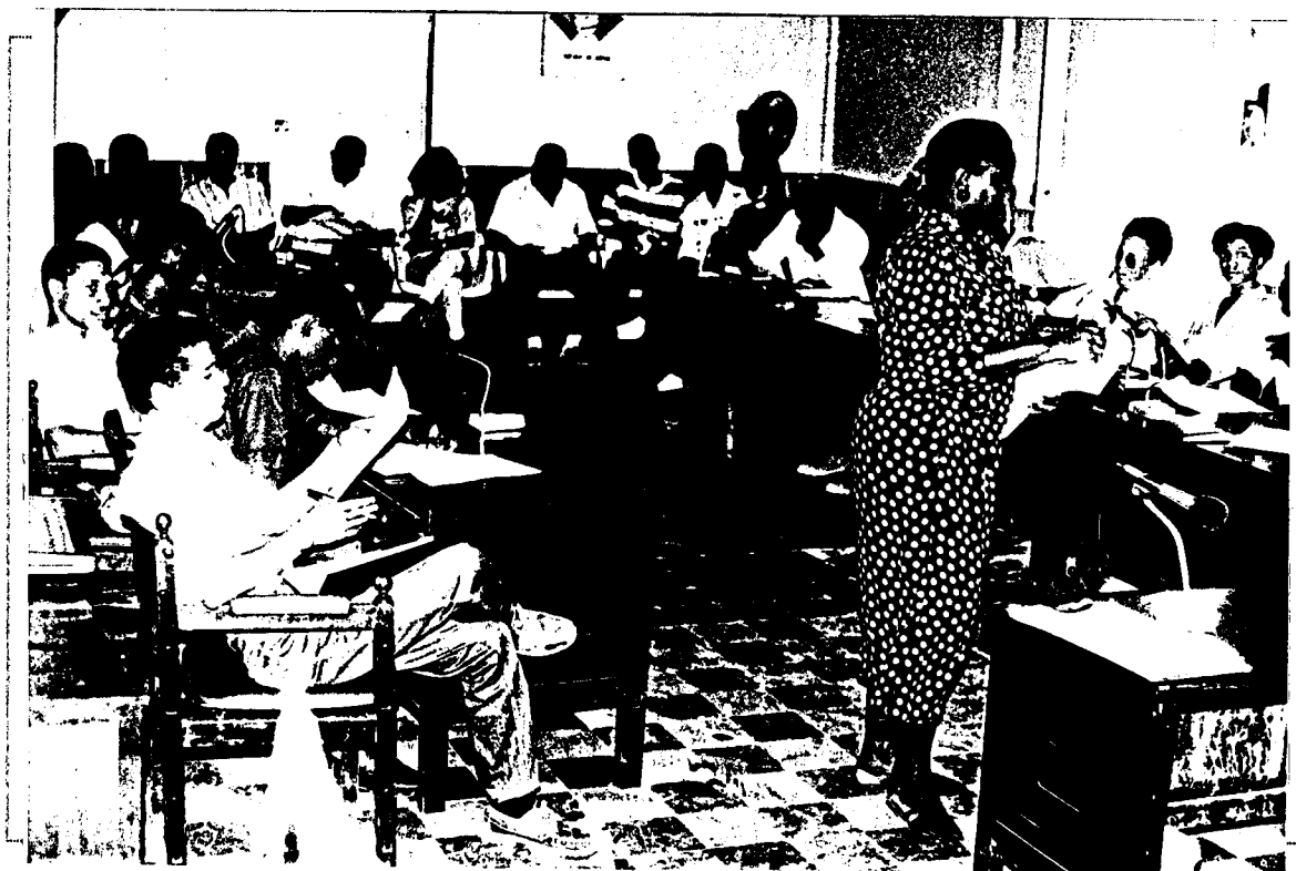
Diversas entidades del municipio, se aprestan a conformar el Comité Interinstitucional - PDI.

De igual forma, algunos sectores no pasaron la prueba al no colaborar con sus aportes al enriquecimiento del instructivo, el cual debía continuar aplicándose desde un mes antes en el taller rural de Primavera, pero que ahora se realizaría del 17 al 18 de Abril. Finalmente, se indicó que la primera semana de Abril vendrán funcionarios de CVC - PLADEICOP, UNICEF y CINDE, donde la comunidad podrá dilucidar interrogantes referentes a los programas impulsados por ellos.